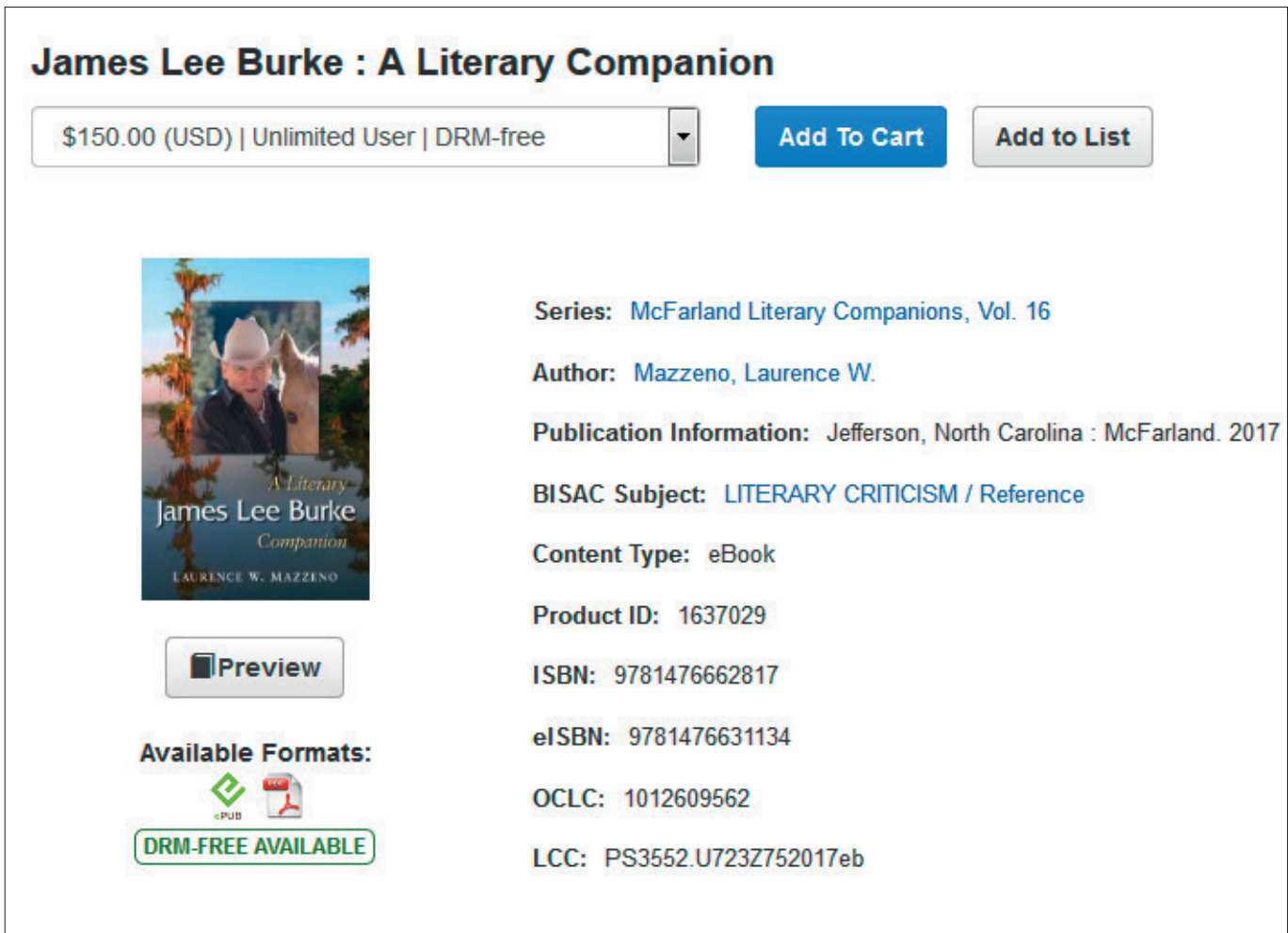
Abb. 1: Hinweis auf ein DRM-freies eBook im EBSCO Collection Management (ECM)

EBSCO hat ein neues Erwerbungsmodell namens EBSCO eBook Selection gestartet, kurz EBS, das aber trotz desselben Akronyms nicht völlig identisch ist mit dem Erwerbungsmodell Evidence Based Selection . EBSCOs EBS ist vielmehr eine Kombination von Leih- und Kaufmodell.