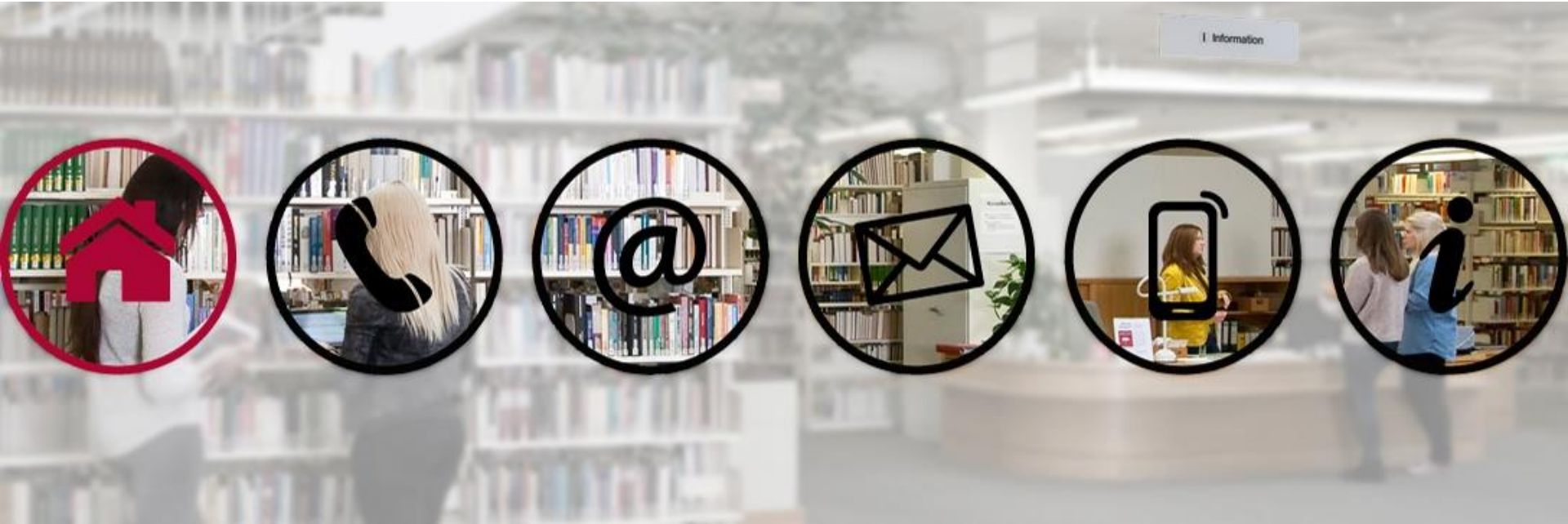
Foto: Stephan Schute, Vektorgrafik: Fotolia / Do Ra, Universitätsbibliothek Osnabrück