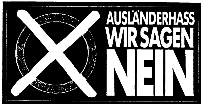
Abb. 1: Ausländerhaß - Wir sagen Nein

Machen Sie mit: Sie bringen mit diesem Aufkleber sichtbar zum Ausdruck, daß Sie gegen Ausländerhaß und Rassismus sind.