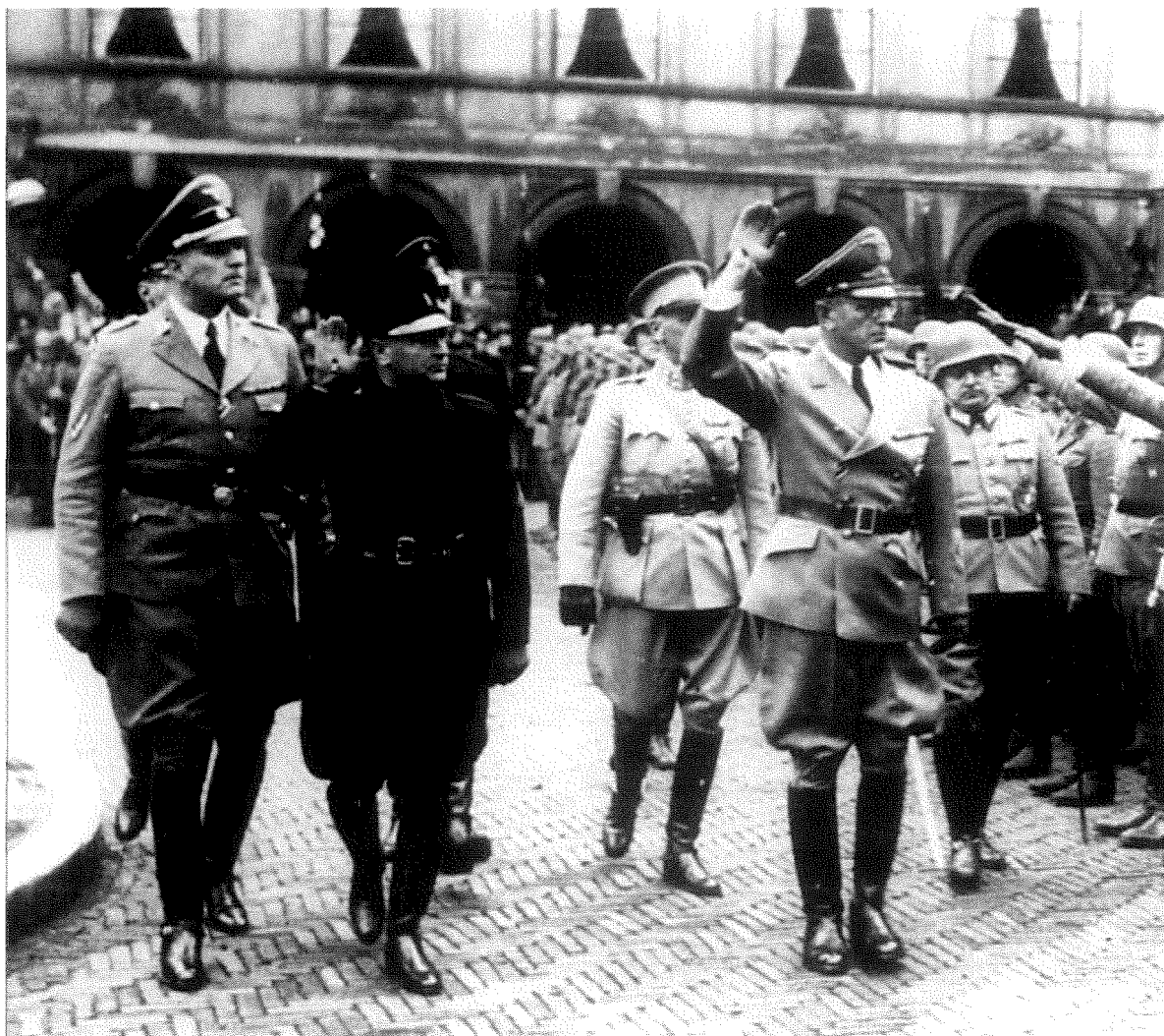
Abb. 2: Seyß-Inquart (Mitte rechts) beim Abschreiten einer Ehrenformation