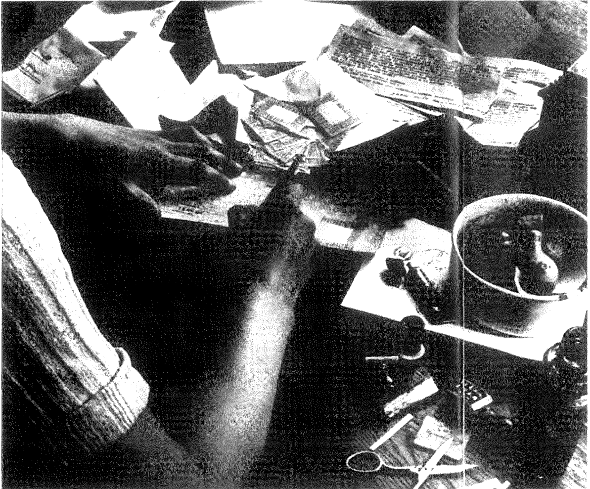
Abb. 6: Blick in eine Fälscherwerkstatt

bisher nicht beachtete Abstammung und, wenn möglich, unter Vorlegung irgendwelcher Beweise dafür.« 12