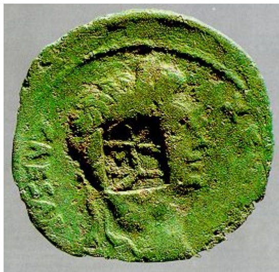
Bild links: Kupfermünze (as) des Augustus mit Gegenstempel VAR des P. Quinctilius Varus, geprägt 8-3 v.Chr. in Lugudunum/Lyon. - Dm. 25,5-27 mm.

Die auch in Kalkriese aufgefundenen, teils mit entsprechenden Gegenstempeln des Varus ( VAR ) versehenen Kupfermünzen mögen die Bemühungen um die Einführung oder Regelung des Geldsystems in der im Entstehen begriffenen Provinz dokumentieren, sofern sie nicht nur für die römischen Legionäre bestimmt waren. So dienten offenbar auch die sogenannten Sommerfeldzüge des Varus eher der römischen Machtdemonstration und der Realisierung des provinziellen Herrschaftssystems als eigentlichen militärischen Zielen, denn die Germanen schienen für Rom gewonnen. Diese Unternehmungen bieten mit ihrem umfangreichen Tross, den Zivilangehörigen, Frauen und Sklaven auch eine Erklärung für die nicht-erkannte Gefahr einer Verschwörung und die Ahnungslosigkeit, mit der Varus dann in die ihm gestellte Falle marschierte.