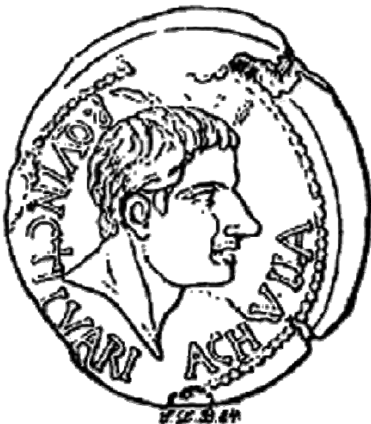
Bild links: P. Quinctilius Varus. - Holzschnitt A. von Sallets nach einem Gipsabguß des Pariser Exemplars einer Varus-Münze der Stadt Achulla, Provinz Africa proconsularis .

Die Karriere des Varus verlief dementsprechend. Nach dem von Augustus verordneten Intervall von 5 Jahren durfte er die neben Asia, dem heutigen Westkleinasien, vornehmste Provinz Africa verwalten, das heutige Tunesien, die an sich dem Senat vorbehalten war. Darüber sind wir nur durch - nicht datierte - Münzen unterrichtet, die unter seinem Proconsulat in Achulla und Hadrumetum geprägt wurden. Sie lassen teilweise die individuellen Gesichtszüge des Statthalters erkennen. Eine Frage bleibt allerdings die Bedeutung dieses ungewöhnlichen Aktes, des Rechts auf Münzprägung mit dem Bildnis eines Statthalters, was wohl nur in Zusammenhang mit den familiären Bindungen dieser Personen zum Caesar zu erklären ist. Es war ein Privileg der amici , also der 'Freunde'. Die eigentliche Statthalterschaft bleibt für uns allerdings im Dunkeln.